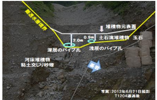
写真—2 パイプ流発生箇所と溪床横断面崩落地

2002年9月から2012年9月までの降雨イベント(全855イベント)を抽出し、RBFNによってパイプ流発生と土石流発生限界雨量線を設定したものを図—2に示す。図—2よりパイプ流が発生しても土石流発生までには余裕がある(最大時間雨量の差13mm、土壌雨量指数の差74.9mm)ことが読み取れる。