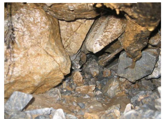
写真一 1 パイプ孔内部

2012 年 6 月 19 日の降雨イベントでは床固め施工掘削横断面においてパイプ流の噴出→パイプ孔の周辺の土砂移動→パイプ流