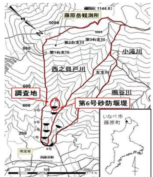
図一 1 調査地地形図

また、第 6 号堰堤施工掘削横断面、床固め工施工掘削横断面などにおけるパイプ流噴き出し状況や過去 4 年間でパイプ流が観測された全 23 箇所からパイプ流の存在箇所の特徴を明らかにした。またニューラルネットワークの方法のうちの 1 つである、RBFN(Radial Basis Function Network)を用い西之貝戸川における土石流発生基準雨量線を非線形で設定し、パイプ流の発生、伏流水の噴き出しとその閉塞、土石流発生との関係性を明らかにした。