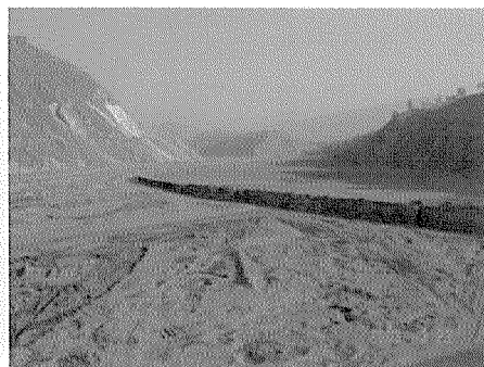
小江河床の堤防により区切られた水田（農地面が河床高より低く常に土砂災害の危険に晒されている）

ような土砂災害が頻発し、人々の命が奪われ、インフラ基盤が破壊され、農地が年々失われて、安全と安定に大きな脅威を与えており、社会経済が未発達のみで貧困度合いが著しく、現在でも中国政府や雲南省政府に貧困地域の指定を受けている。また、頻発する土砂災害は環境生態系にも悪影響を及ぼし、悪化し続ける環境生態は災害発生頻度の増幅させ、貧困問題の解消を更に難しくしている。