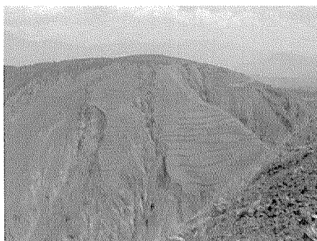
斜面崩壊により危機に瀕する山地斜面の農地

小江流域における土砂災害には、山地斜面（自然斜面と傾斜農地）やガリーの土壌侵食（流亡）、斜面崩壊や地すべり、扇状地における土石流等の直接的な土砂災害、また本川における土砂堆積による河床上昇および支川土石流による小江河道閉塞に伴う洪水氾濫災害等がある。小江全流域（東川区、尋甸県、会澤県）は、この