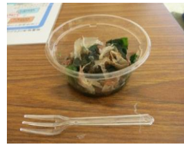
図4 提供した横浜産わかめ

展示ブースには300人と大勢の方に来場いただき、横浜産わかめを提供させていただきました。わかめの調理方法はシンプルに「わかめのしゃぶしゃぶ」で、サッと湯で温めたワカメに鰹節をのせてポン酢などをお好みでかけて食べて頂きました。