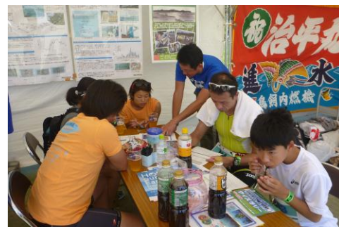
図5 横浜産わかめ試食会の様子

地産地消する効果として、温暖化防止や生物多様性の保全、水質汚濁物質の除去があることを説明すると、「そんないい効果があるなら少し高くても買いたい」という声も多く聞かれました。