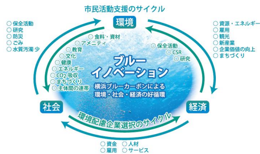
図1 横浜ブルーカーボン事業の目指す姿