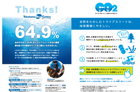
図3 トライアスロン大会の出場者に対する寄付金のPR資料(左)と感謝文(右)

また、H26 横浜シーサイドトライアスロン大会にブース出展していた“日本あん摩マッサージ指圧師会”も横浜ブルーカーボン事業の趣旨に賛同し、マッサージ料金の全額を寄付いただきました。