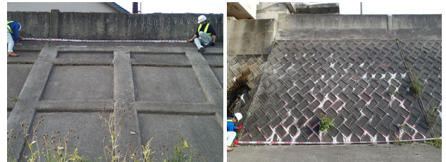
図2 張り護岸(左)と積み護岸(右)の例

またコンクリート護岸は河川砂防技術基準[国土交通省 2019]およびそれに基づく各種要領等に基づき施工されており、工種により張り護岸/積み護岸/擁壁護岸などに分かれ、さらに各工種の中でも張り方や積み方にバリエーションがある。