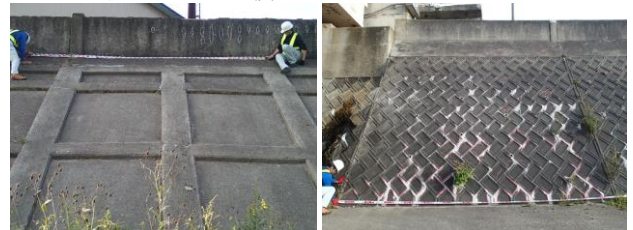
図2 張り護岸(左)と積み護岸(右)の例

またコンクリート護岸は河川砂防技術基準[国土交通省 2019]およびそれに基づく各種要領等に基づき施工されており、工種により張り護岸/積み護岸/擁壁護岸などに分かれ、さらに各工種の中でも張り方や積み方にバリエーションがある。