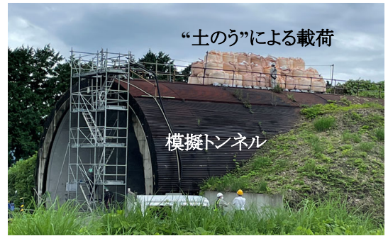
写真-1 模擬トンネルでの載荷試験

建設中の新名神高速道路宇治田原トンネル西工事において、施工中のインバートと覆工への光ファイバ設置方法に関する実証試験を行った。コンクリートに発生する軸力と曲げモーメントを計測することを目的として、断面内の地山側と内空側の2側線設置した。また、維持管理段階における配線を考慮し、将来的に設備の電線や通信線が配線される監査廊下の多孔陶管に配線できるような配線方法を考案し、現場での設置試験を通じて、実現可能性を示した。